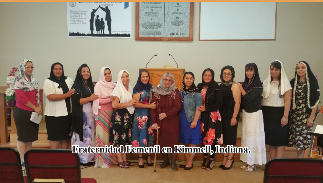
Fraternidad Femenil en Kimmell, Indiana.

Que el Señor les bendiga grandemente y paz a vosotras.